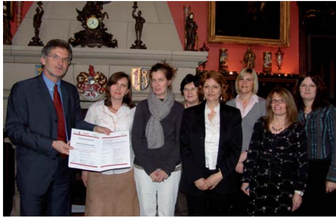
Übergabe der Zertifikate „Begabungspädagogische Fachkraft Stiftung Kleine Füchse “