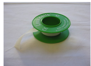
der Klebestreifen (Leukosilk)