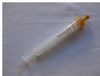
das Blutentnahmeröhrchen (die Monovette)