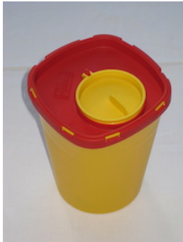
die Abwurfbox, bruch- und stichsicher

b Hier sind die Bilder der Materialien für die Blutentnahme. Ergänzen Sie jeweils die Namen/Bezeichnungen. Nehmen die den Text (siehe 1a) zur Hilfe. (Hinweis: Lassen Sie sich bei Schwierigkeiten die Musterlösung aushändigen, um die Aufgabe b lösen zu können.)